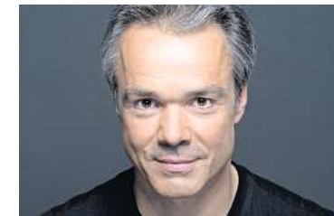
Hannes Jaenicke spricht über Eigensinn.

Am Montag, 11. Dezember, tritt Hannes Jaenicke im Theater am Aegi auf. Er präsentiert sein Buch „Wer der Herde folgt, sieht nur Ärsche“ und beantwortet Fragen. Beginn ist um 20 Uhr, Karten gibt es ab 27,25 Euro zuzüglich Gebühren in den HAZ-Ticketshops. Vorab können HAZ-Leser heute Fragen an hannover@haz.de mit dem Stichwort „Hannes Jaenicke“ schicken. Unter den Teilnehmern verlosen wir fünfmal zwei Karten. Der Rechtsweg ist ausgeschlossen.