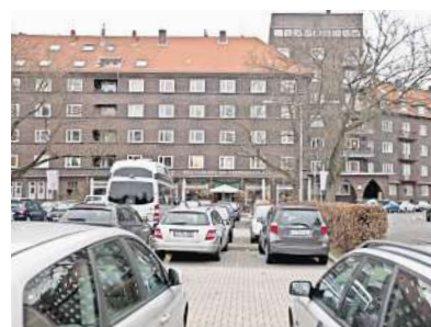
Parkflächen vor dem Café Högers am Stephansplatz.

Vorbild ist ein Bauprojekt am Münchener Dantebad. Dort hat eine Wohnungsbaugesellschaft auf einem alten Parkplatz 100 Wohnungen errichtet – weil das Haus aber aufgeständert ist, sind die Parkplätze weiterhin nutzbar. „Um dem Wohnraumbedarf gerecht zu werden, müssen wir innovative Lösungen finden“, sagt Grünen-Baupoli-