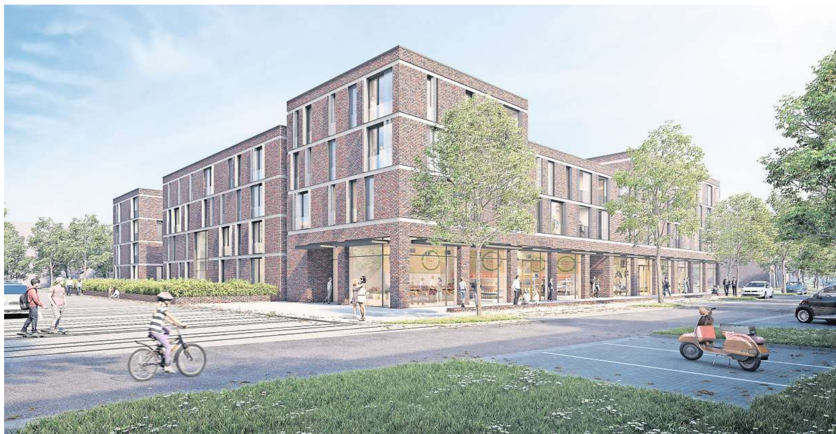
So könnten die ersten Gebäude auf dem Gelände der Wasserstadt Limmer aussehen.

Baudezernent Uwe Bodemann hofft, einen Abriss noch abwenden zu können. „Vielleicht kommt ein weiteres Gutachten zu dem Schluss, dass die Gebäude noch für Büros oder Wohnungen nutzbar sind“, sagt er. Sollte aber kein wirtschaftlicher Nutzen möglich sein, könne auch der Denkmalschutz einen Abriss nicht verhindern. Bisher dienen die Fabrikrümpfe als Lärmschutzwand für die geplanten ersten Wasserstadt-Häuser. Sollten die Fabrik-